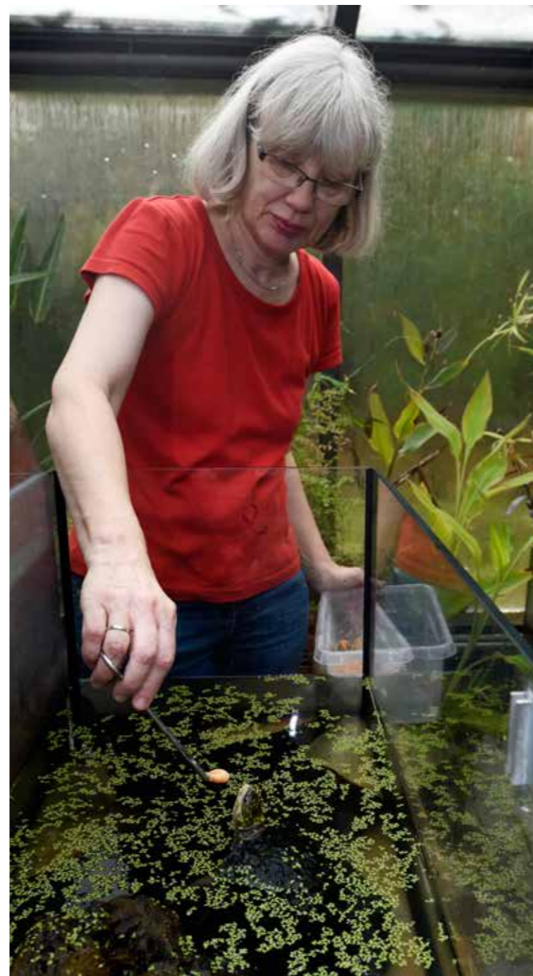
Fütterung der Schildkröten

Durch Ihre Spende kann das Projektteam des Schildkrötenschutzentrums in Münster die Zuchtbemühungen der seltenen Schildkröten langfristig verwirklichen. Ziel ist die Erhaltung und Vermehrung akut von Ausrottung bedrohter südostasiatischer Schildkrötenarten. Der Aufbau stabiler Populationen für weitere Erhaltungszuchten ist dazu ebenso notwendig wie das Ziel, „best practice“ – Erkenntnisse über ihre Haltung und Zucht zu sammeln und zu veröffentlichen sowie Wildbestände zu stabilisieren.