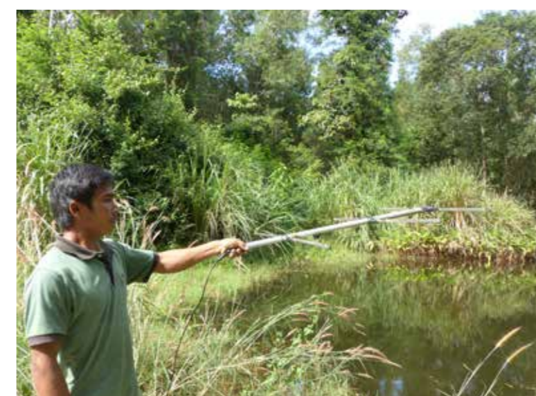
Feldarbeit im ACCB