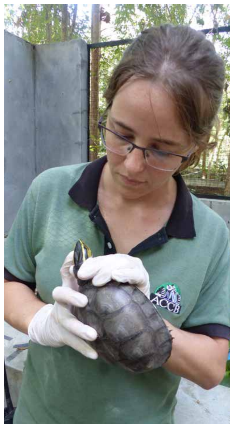
Tierärztliche Untersuchung der Schildkröten im ACCB

Durch Ihre Spende werden Amboina-Scharnierschildkröten ( Cuora amboinensis ) unter naturnahen Bedingungen vor Ort gezüchtet. Es wird darauf hingearbeitet, Nachzuchten in einem gut geschützten Gebiet unter wissenschaftlichen Gesichtspunkten anzusiedeln. Weitere Ziele sind, das Umweltbewusstsein zu steigern und Kompetenzen im Bereich Naturschutz- und Umweltmanagement aufzubauen sowie eine nachhaltigere Nutzung natürlicher Ressourcen zu fördern.