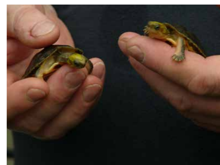
Nachzuchten der Goldkopf- Scharnierschildkröten ( Cuora aurocapitata )