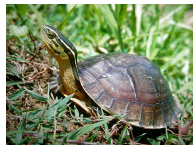
Nachzuchten der Amboina-Scharnierschildkröte ( Cuora amboinensis )