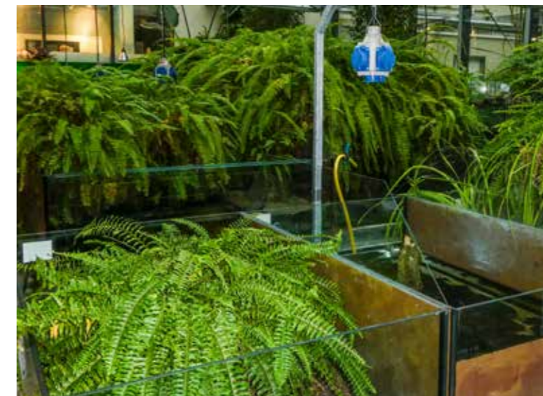
Blick in die Zuchtstation des „Internationalen Zentrums für Schildkrötenschutz“